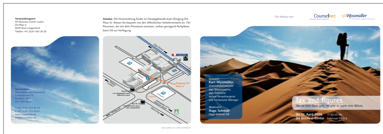
Einladung gemeinsamer Kundenanlass